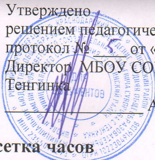
Таблица-сетка часов Индивидуального учебного плана обучающихся 6 класса МБОУ СОШ №18 им. С.В. Суворова с. Тенгинка, прибывших из Запорожской, Херсонской областей и Украины на 2022 – 2023 учебный год